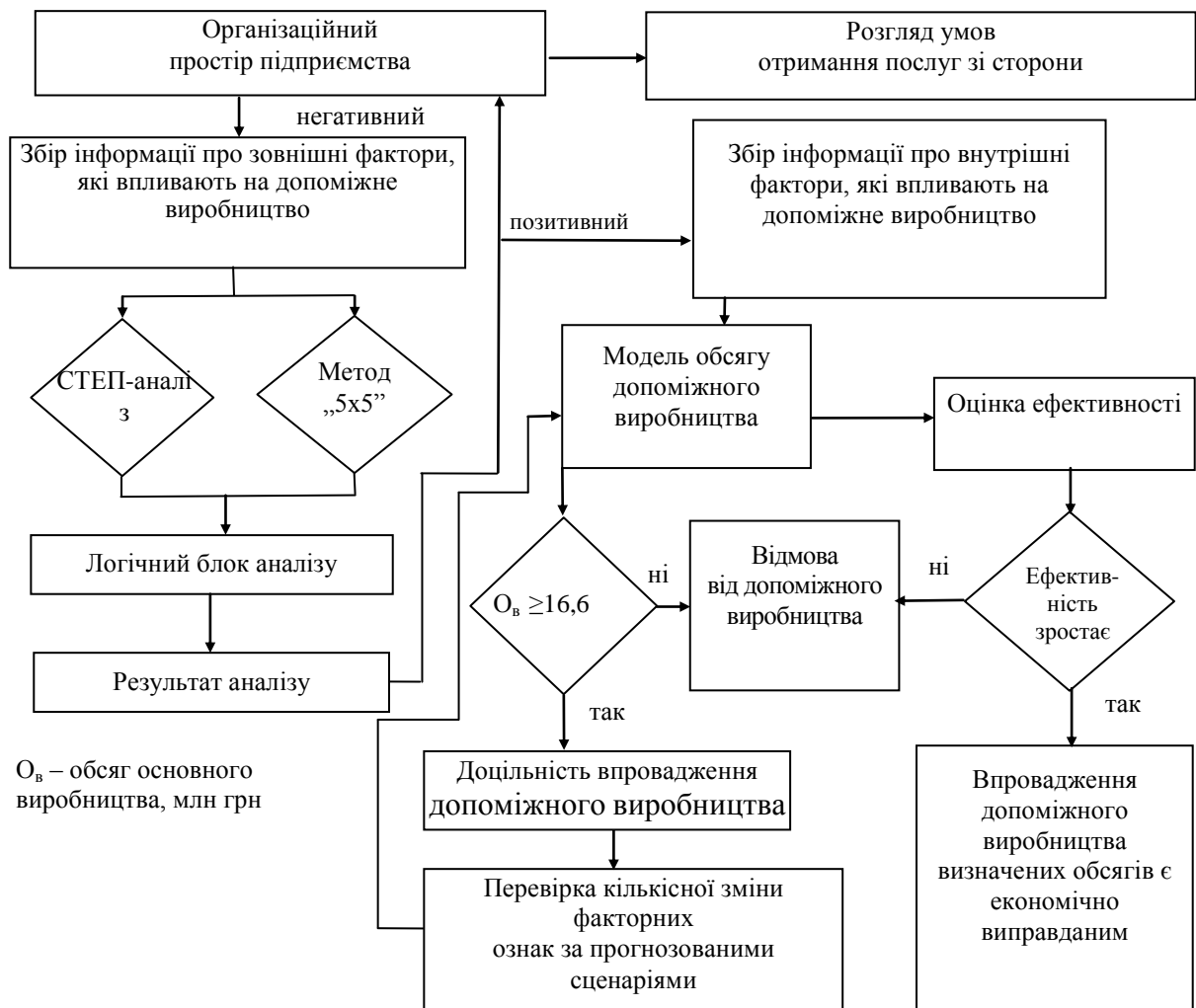
Рис. 2. Блок-схема оптимізації обсягу допоміжного виробництва

Відповідно до концепції альтернативної вартості витрати з виробництва, що передається на аутсорсинг підприємством-замовником, завжди повинні порівнювати із вартістю виготовлення продукції власними силами або через спільні підприємства. Таким чином, для ВАТ „Луцький підшипниковий завод” будуть вигідні контракти з аутсорсингу за ціною підприємства-провайдера нижче 51 грн за нормо-годину, для ВАТ „Електротермометрія” – 46 грн за нормо-годину, для СП ТзОВ „Модерн-Експо” – 29 грн за нормо-годину.