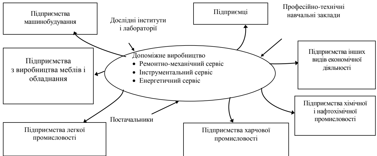
Рис. 3. Модель кластера допоміжного виробництва

обслуговувати головне підприємство, тобто окремі види допоміжного виробництва є самостійними підприємствами у кластерному середовищі; об'єднання декількох потужних підприємств в єдину виробничу структуру (без втрат майнової незалежності) для більш повного використання сировини, обладнання, випуску складної продукції. Ці дві моделі передбачають створення центрального органу управління кластера, куди б входили керівники та спеціалісти цих підприємств. Модель такого кластера подано на рис. 3.