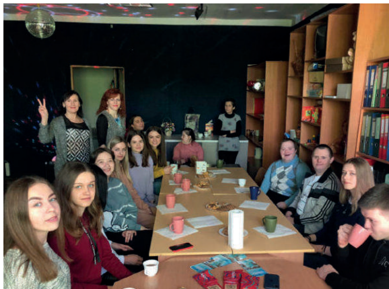
Чемпіонат області з риболовного спорту серед осіб із ураженнями опорно-рухового апарату та порушеннями слуху й інклюзивно-мистецькі заходи «Територія щирої дружби» в Музеї сучасного українського мистецтва Корсаків