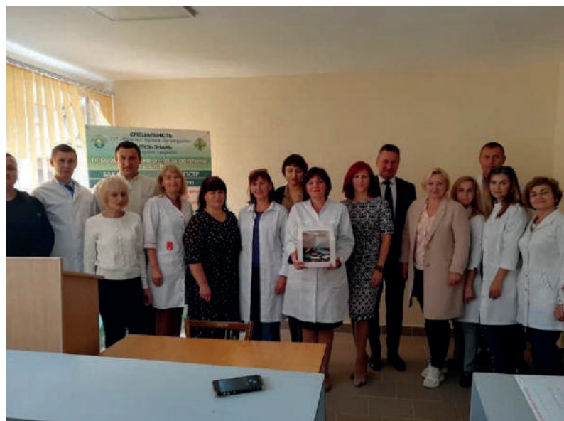
Урочисте святкування Всесвітнього дня фізичного терапевта, 2021 рік