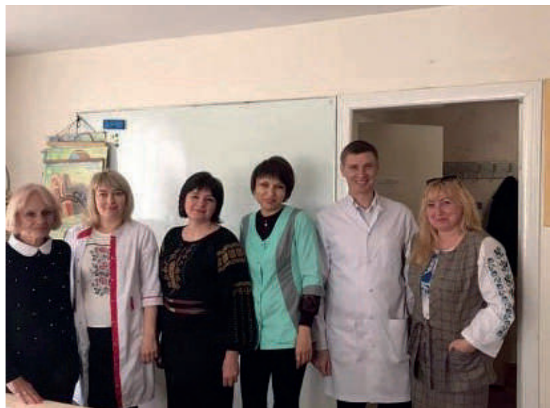
Участь у міжнародних і всеукраїнських конференціях та науково-дослідна діяльність на кафедрі (2019–2021 роки)