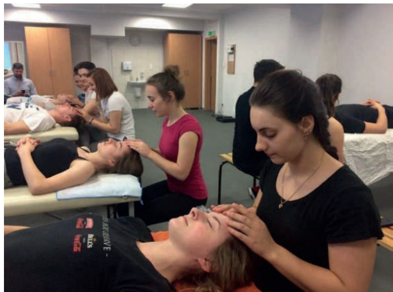
Стажування студентів (Республіка Польща) (2018 рік)