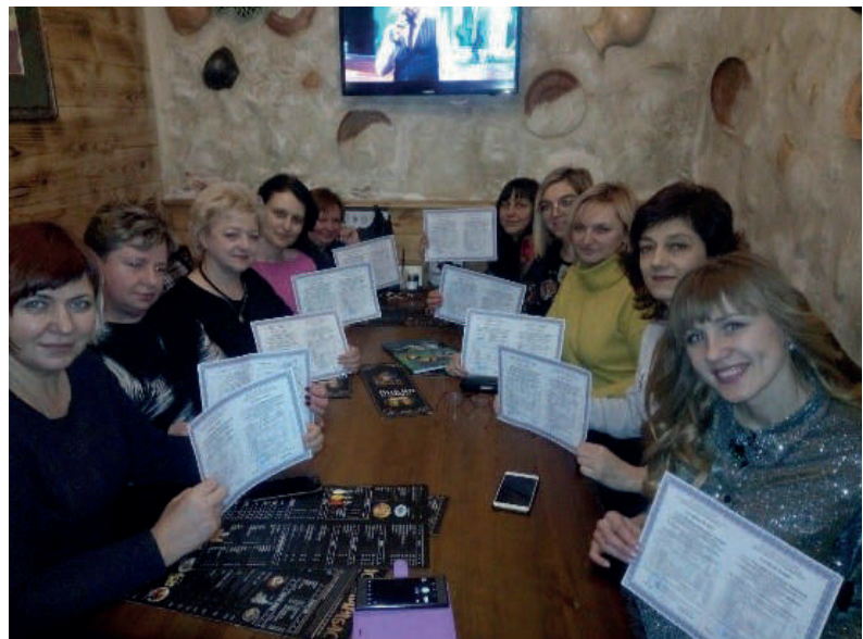
Сертифікатні курси для підвищення кваліфікації фахівців (2020–2021 роки)