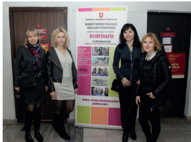
Науково-педагогічне стажування в Академії імені Яна Дługоша в Ченстохові (Республіка Польща) (2016–2017 роки)