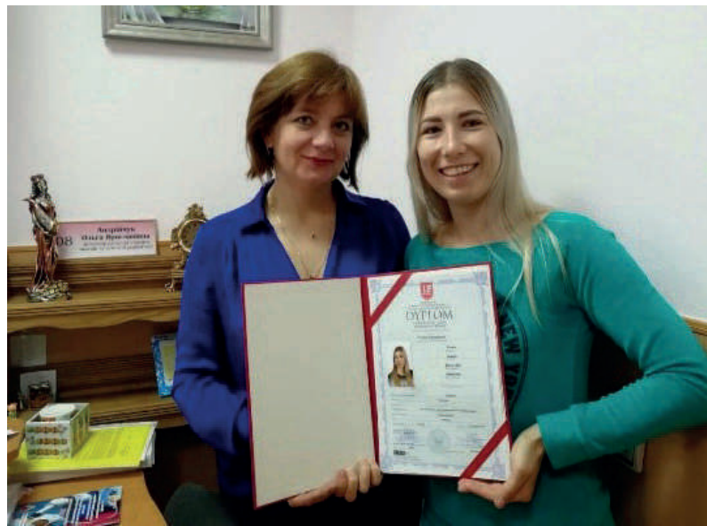
Навчання студентів за програмою «Подвійний диплом» (Республіка Польща) (2016–2018 роки)