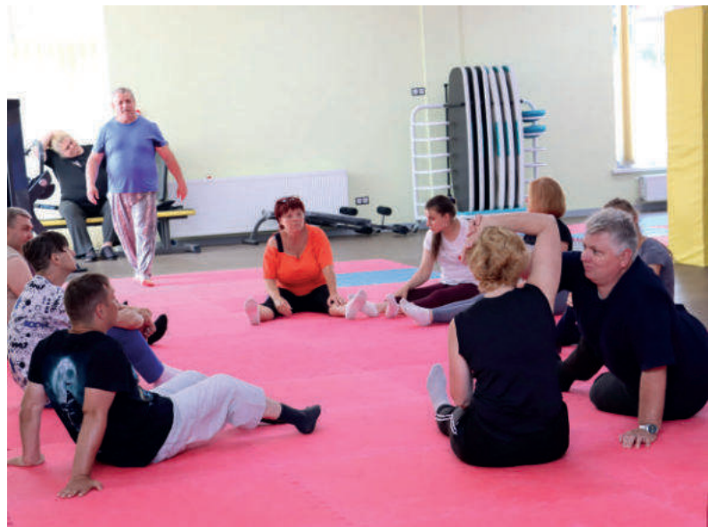
Проходження студентами практики у Західному реабілітаційно-спортивному центрі НКСІУ